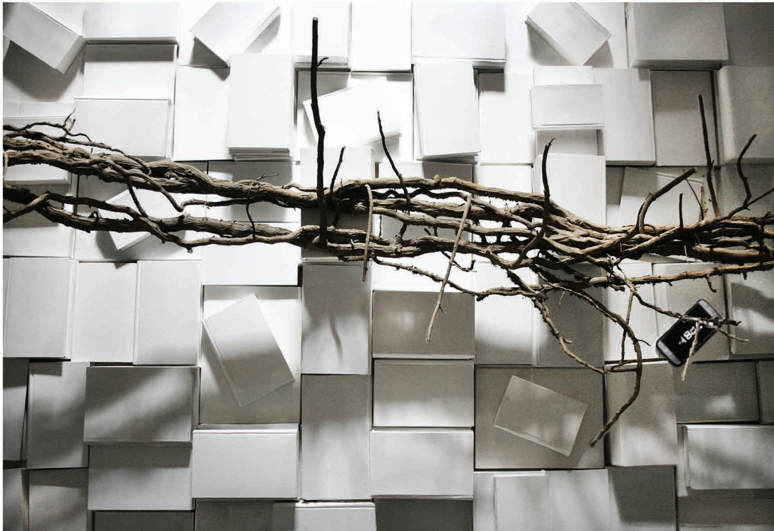
Oben: Durchfluss, Installation, 2021, Fragment Rechts: Ohne Titel, Installation, 2020