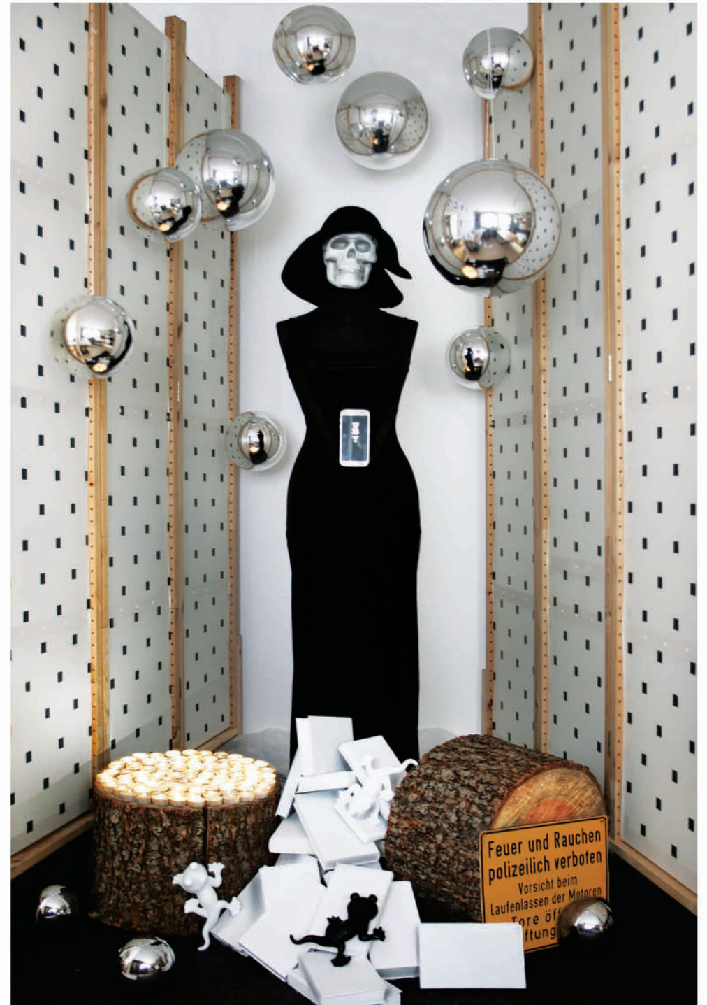
Oben: Installation, 2021, Fragmente Rechts: Questkammer I, Installation, 2021