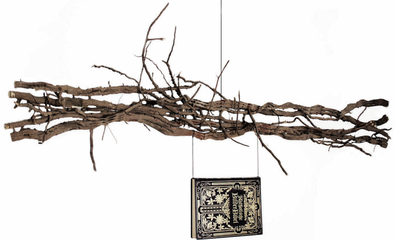
Metamorphose I, Installation, 2019, 206 x 109 x 63 cm