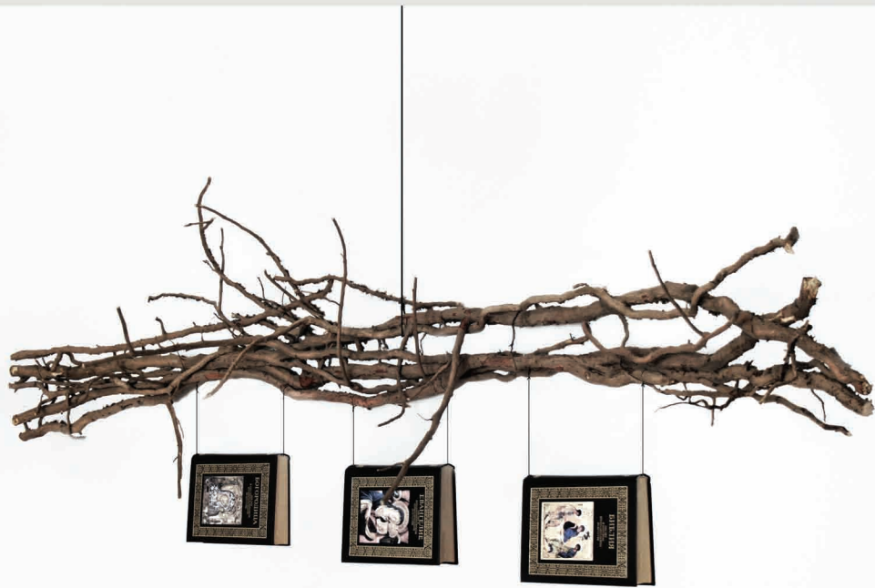
Oben: Metamorphose II, Installation, 2019, 101 x 217 x 61 cm Rechts: Ohne Titel, Installation, 2021