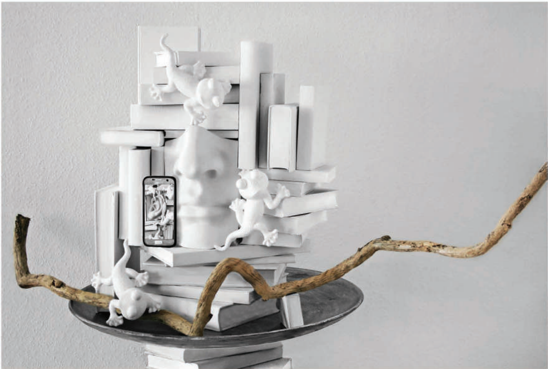
Oben: Objekt mit Nase, 2021, 87 x 141 x 65 cm Rechts: Fallen, Installation, 2019