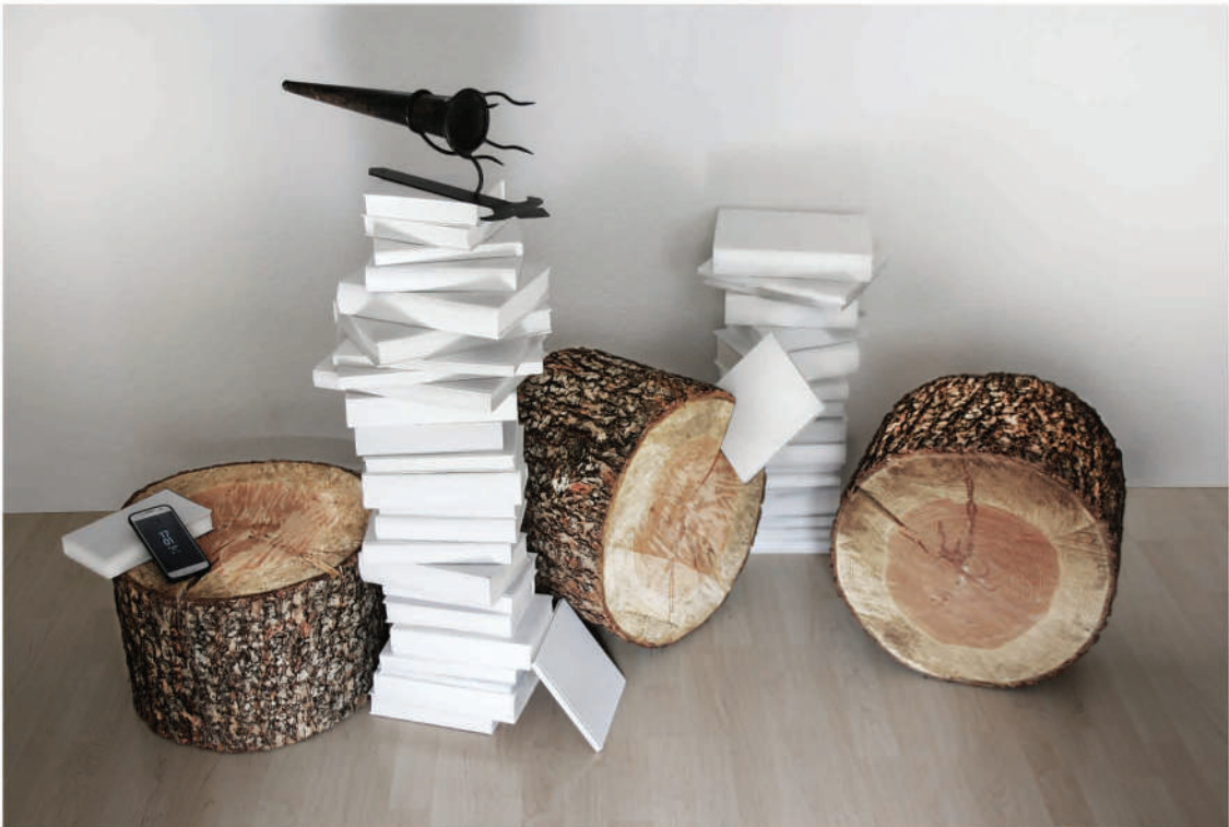
Oben: Ohne Titel, Installation, 2021 Rechts: Maske II, Installation, 2020