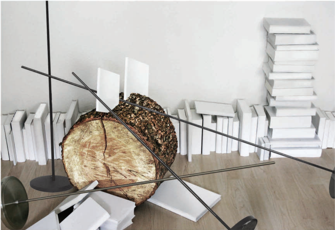
Oben: Ohne Titel, Installation, 2021, Fragment Rechts: Sturz, Installation, 2019