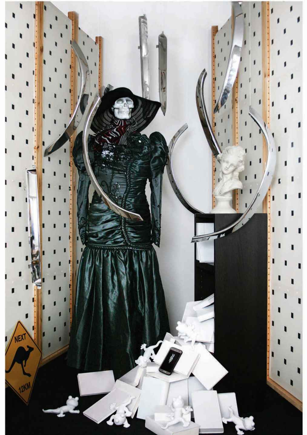
Oben: Installation, 2021, Fragmente Rechts: Questkammer II, Installation, 2021