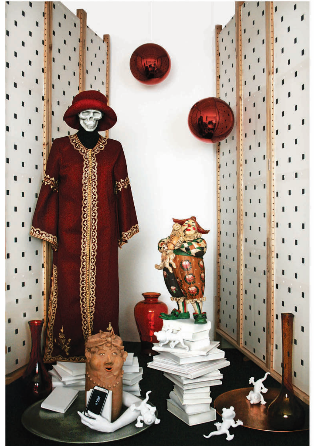
Oben: Installation, 2021, Fragmente Rechts: Questkammer IV, Installation, 2021