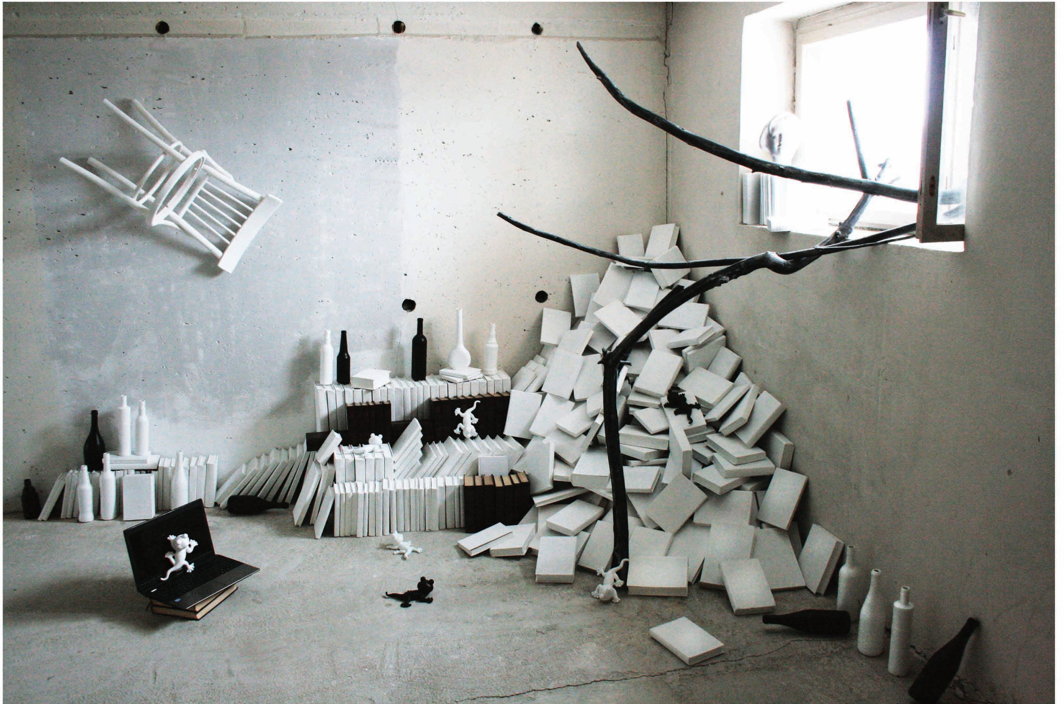
Ohne Titel, Installation, 2019