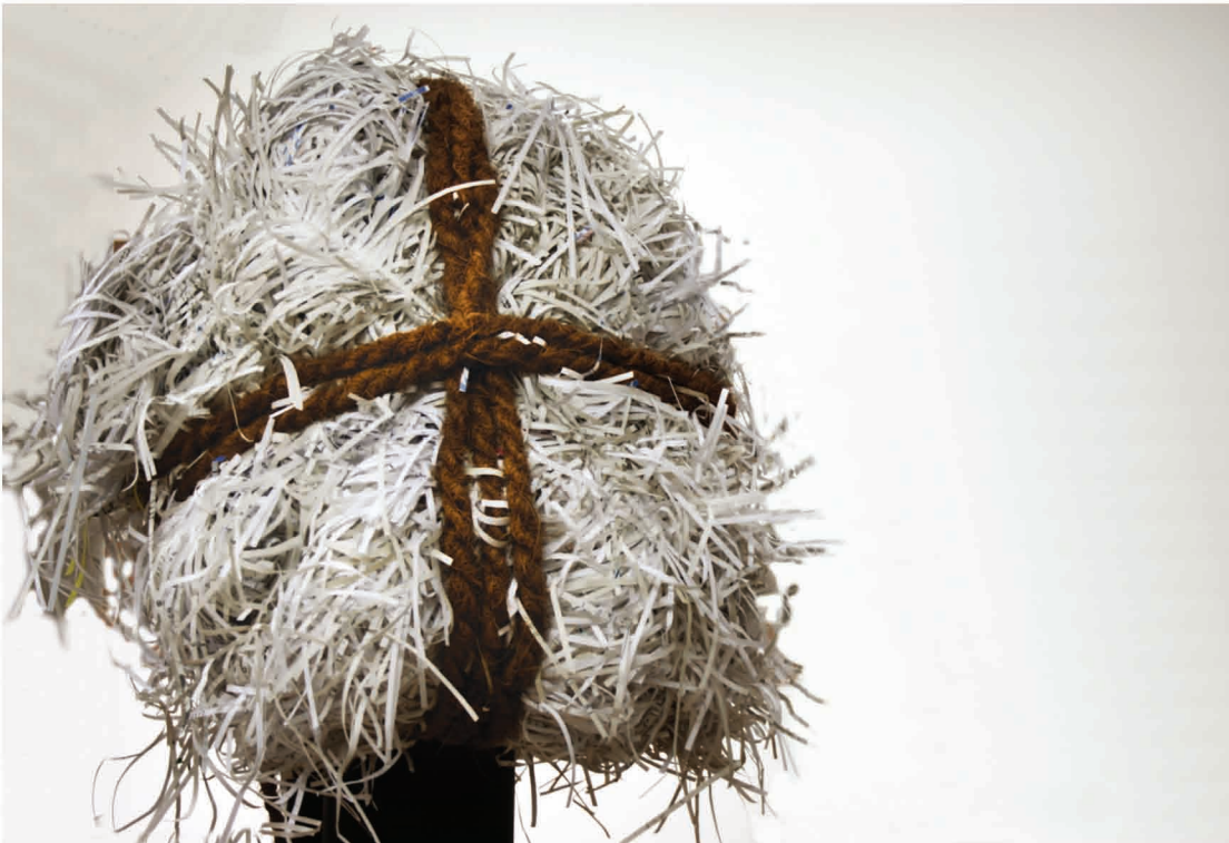
Oben: Kopf, Objekt, 2008, 72 x 60 x 43 cm Rechts: Tanz, Installation, 2008