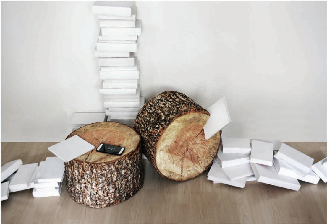
Oben: Ohne Titel, 2021, Fragment