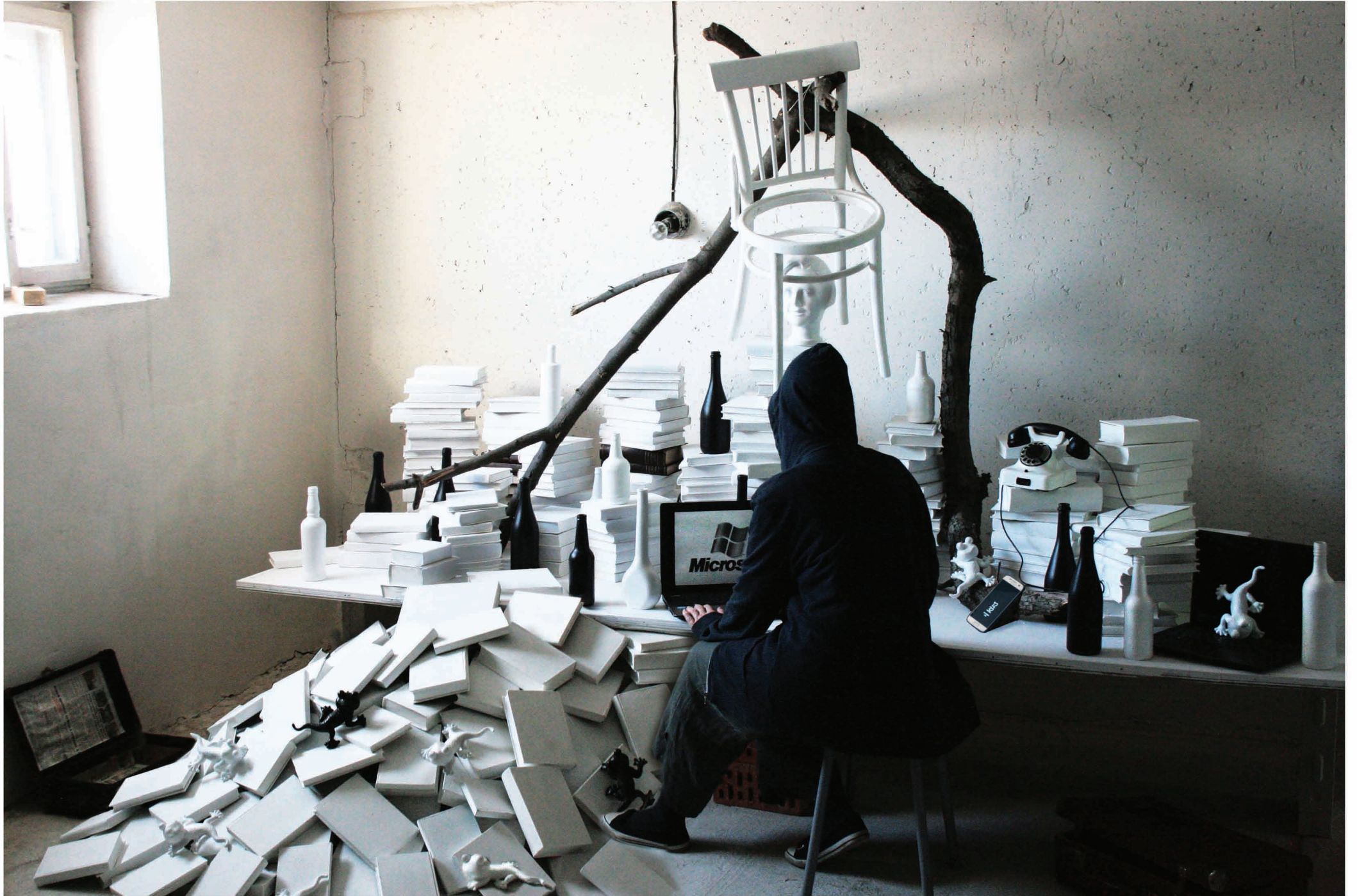
Ohne Titel, Installation, 2020