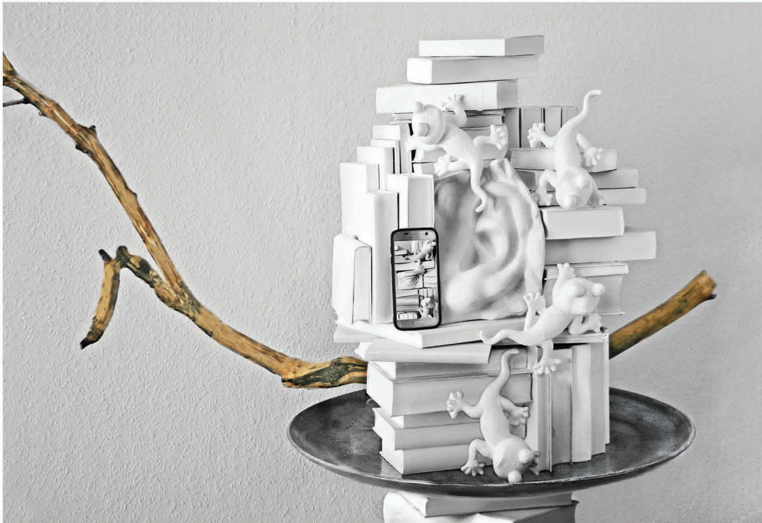
Oben: Objekt mit Ohr, 2021, 89 x 146 x 65 cm Rechts: Ohne Titel, Installation, 2018