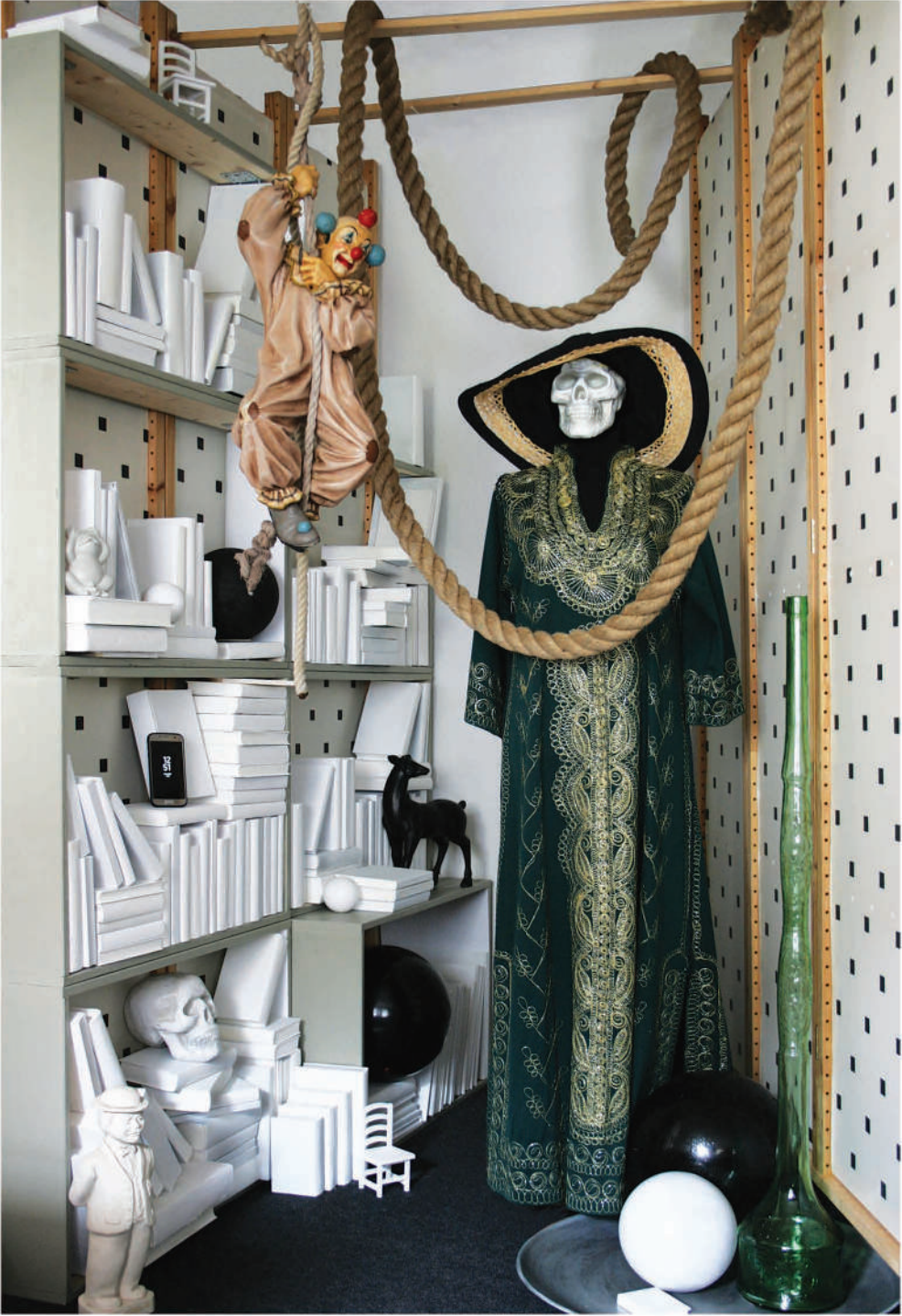
Oben: Installation, 2021, Fragmente Rechts: Questkammer III, Installation, 2021