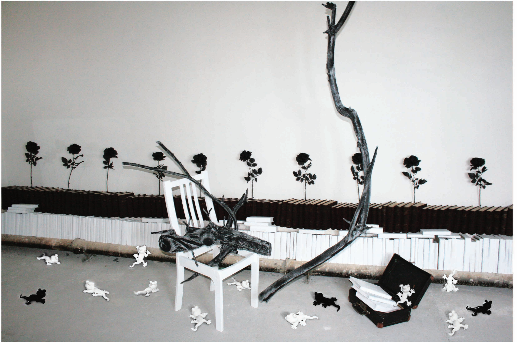
Ohne Titel, Installation, 2019