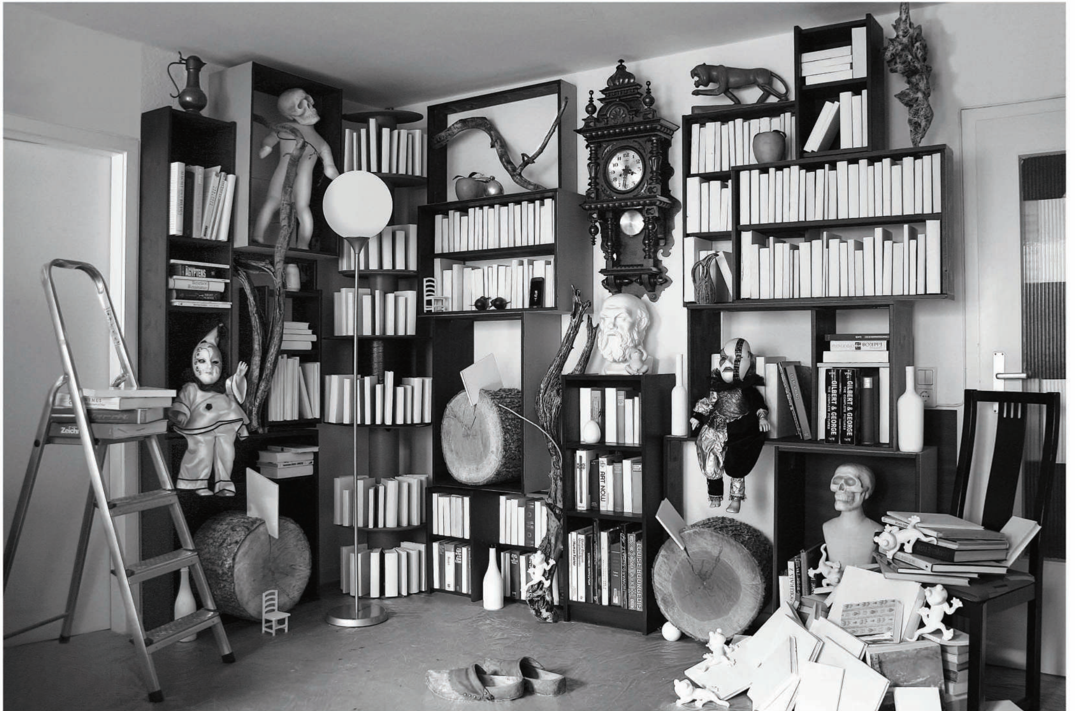
Ohne Titel, Installation, 2021