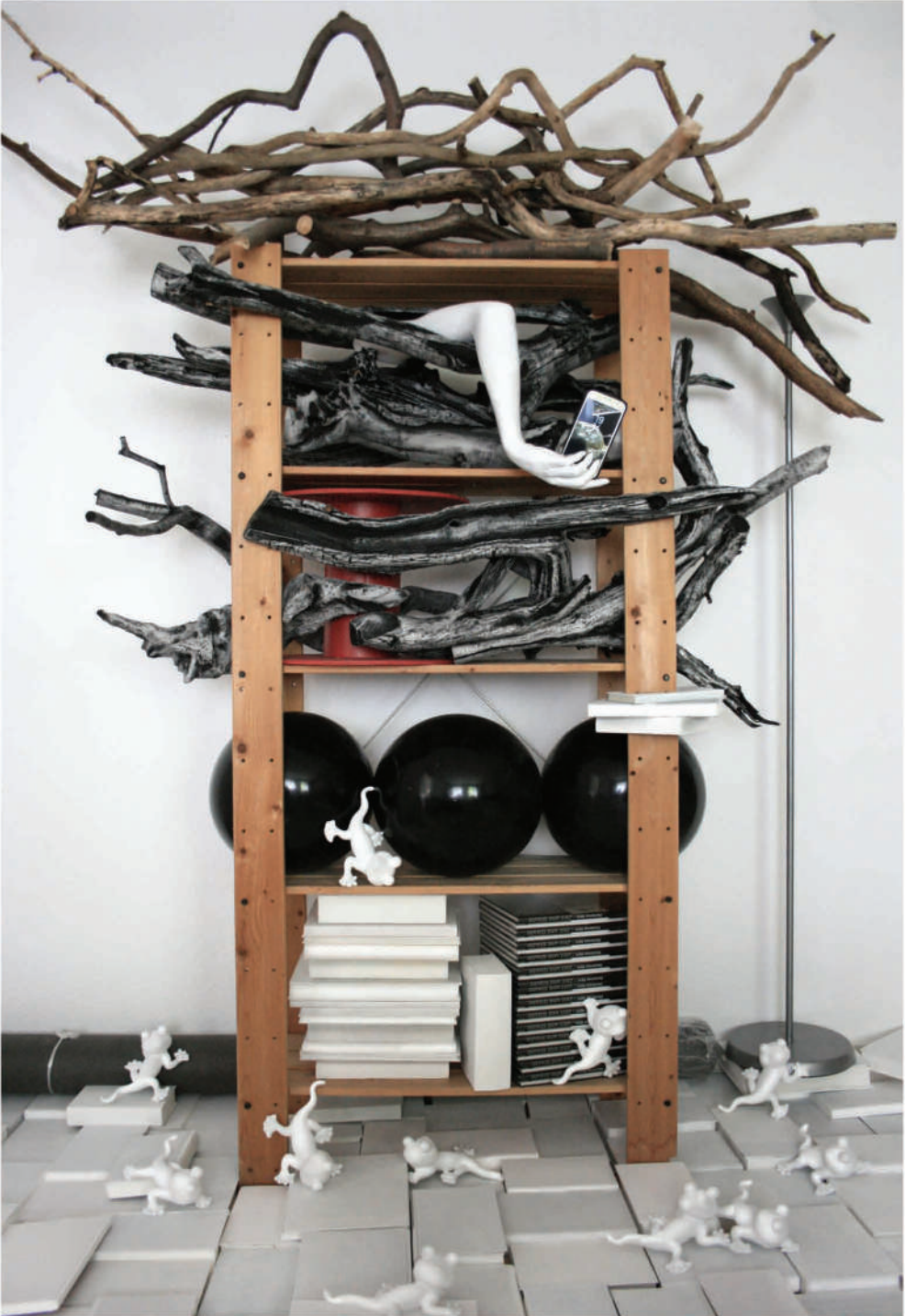
Oben: Installation, 2021, Fragmente