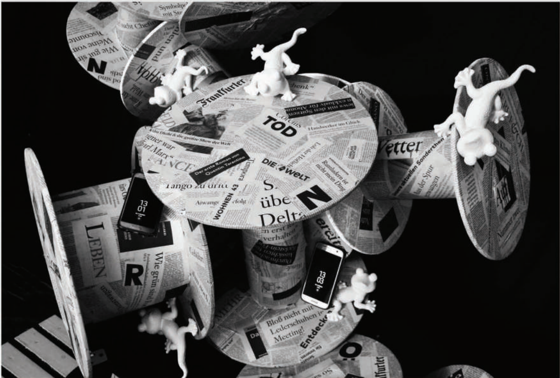
Oben: Ohne Titel, Installation, 2018, Fragment Rechts: Zeit, Installation, 2019, 251 x 103 x 61 cm