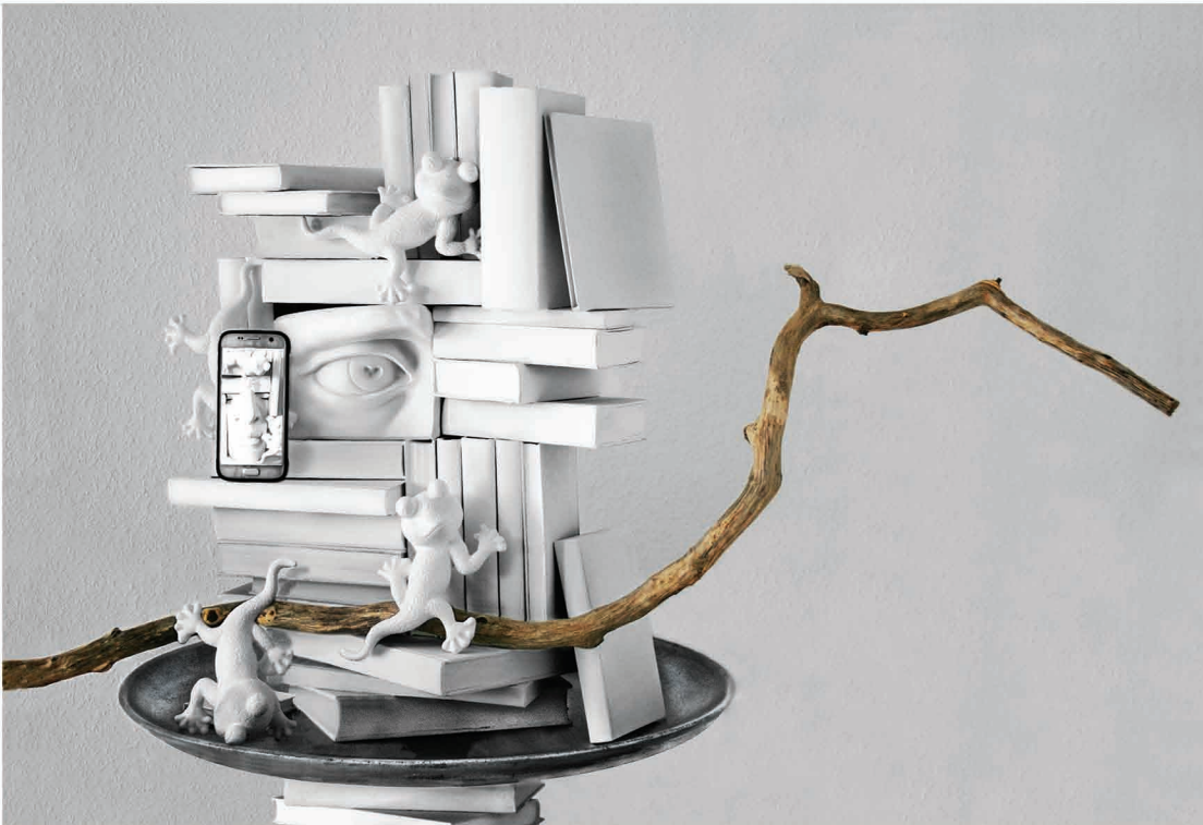
Oben: Objekt mit Auge, 2021, 84 x 126 x 65 cm Rechts: Maske I, Installation, 2017