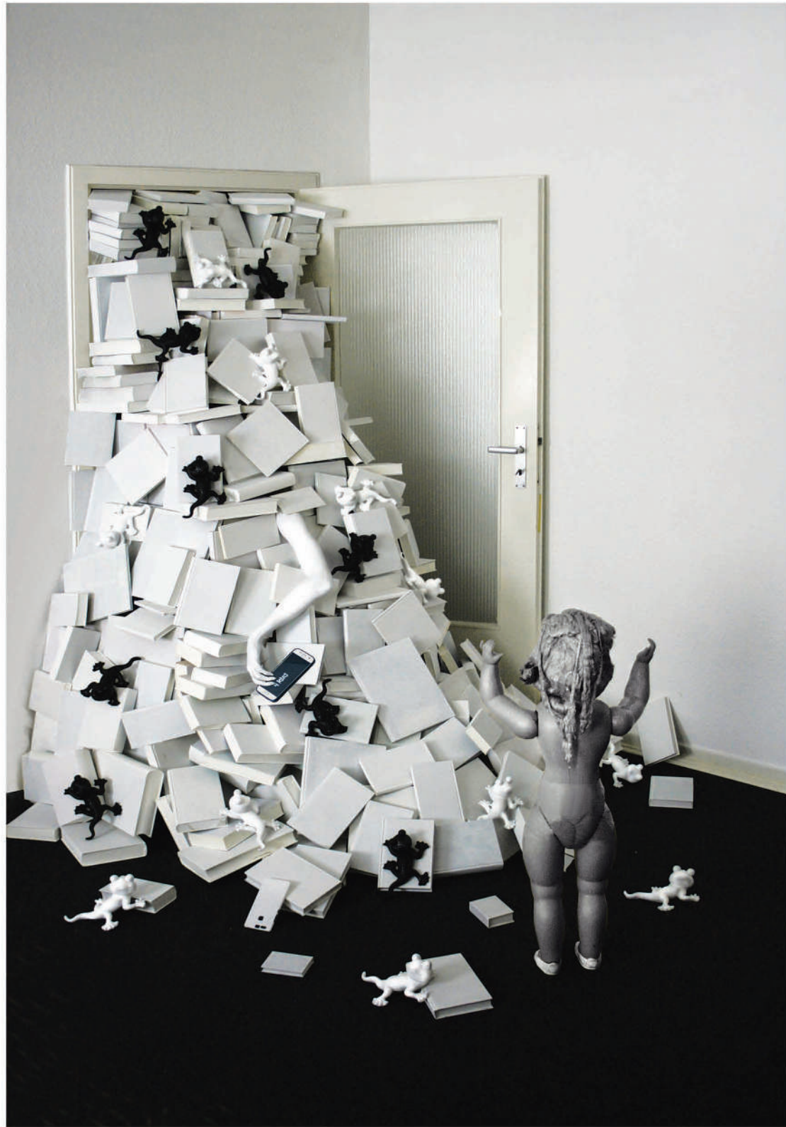
Rechts: Eindringung, Installation, 2021